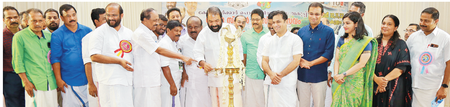
എറണാകുളത്ത് ഇന്നലെ ആരംഭിച്ച സംസ്ഥാന ശാസ്ത്രോത്സവം ട്രാൻസ്ഫോമിംഗ് വിദ്യാലയം ഉദ്ഘാടനം ചെയ്യുന്നു.