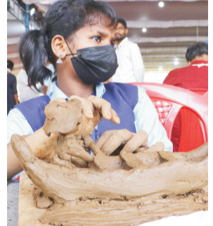
എറണാകുളത്ത് നടക്കുന്ന സംസ്ഥാന സ്കൂൾ ശാസ്ത്രോത്സവത്തിലെ പ്രവൃത്തി പരിചയമേളയിൽ സ്പെഷൽ സ്കൂൾ വിഭാഗത്തിൽ കഴിഞ്ഞ ഡേയ്കളിൽ സെലിക്ട് ചെയ്ത അഞ്ചംഗ സംഗീതസമിതിയുടെ അദ്ധ്യക്ഷനായിട്ടുള്ള എൻ.പി.എസ്.എസ്. ഫോർ റ്റേർ തിരുവല്ല, പത്തനംതിട്ട.

കൊച്ചി: അകക്കണ്ണിന്റെ വെളിച്ചത്തിൽ സൂചി കോർത്ത് കൂടശീലയിൽ കന്നി സുകർമതയോടെ പിടിച്ചുകൊണ്ടിരിക്കുന്ന നിവേദിത കഴ്ചക്കാര്യകർമ്മമായി. അതിലേറെമാണ് എൻപത് ശതമാനത്തോളം കാഴ്ചവെക്കലുമുള്ള അവർ കൂടനീർമണ പൂർത്തിയാക്കിയത്. ഒന്നും രണ്ടുമല്ല, മൂന്നു കൂടകൾ. അതും നല്ല പൂർണ്ണതയോടെ. ഒന്നാം ക്ലാസിൽ പഠിക്കുന്ന കുട്ടിയായിരുന്നു പ്രതികരിക്കുന്നതിലും അച്ചുതലമുറയുടെ സംസ്ഥാന സ്കൂൾ ശാസ്ത്രോത്സവത്തിൽ കൂടനീർമണമർസരത്തിൽ ഈ കൊച്ചുമിടുക്കിയുടെ പ്രകടനം. കാഞ്ഞിരപ്പള്ളി അസ്സീസിസ് സ്കൂൾ ഓഫ് ബ്ലോസ്സംബിലെ എൽപി വിഭാഗം ഒന്നാം ക്ലാസ് വിദ്യാ